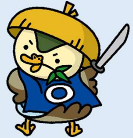
イメージキャラクター 「あぢかもくん」